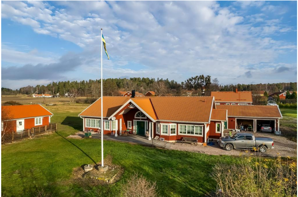
Mangårdsbyggnad med flygel