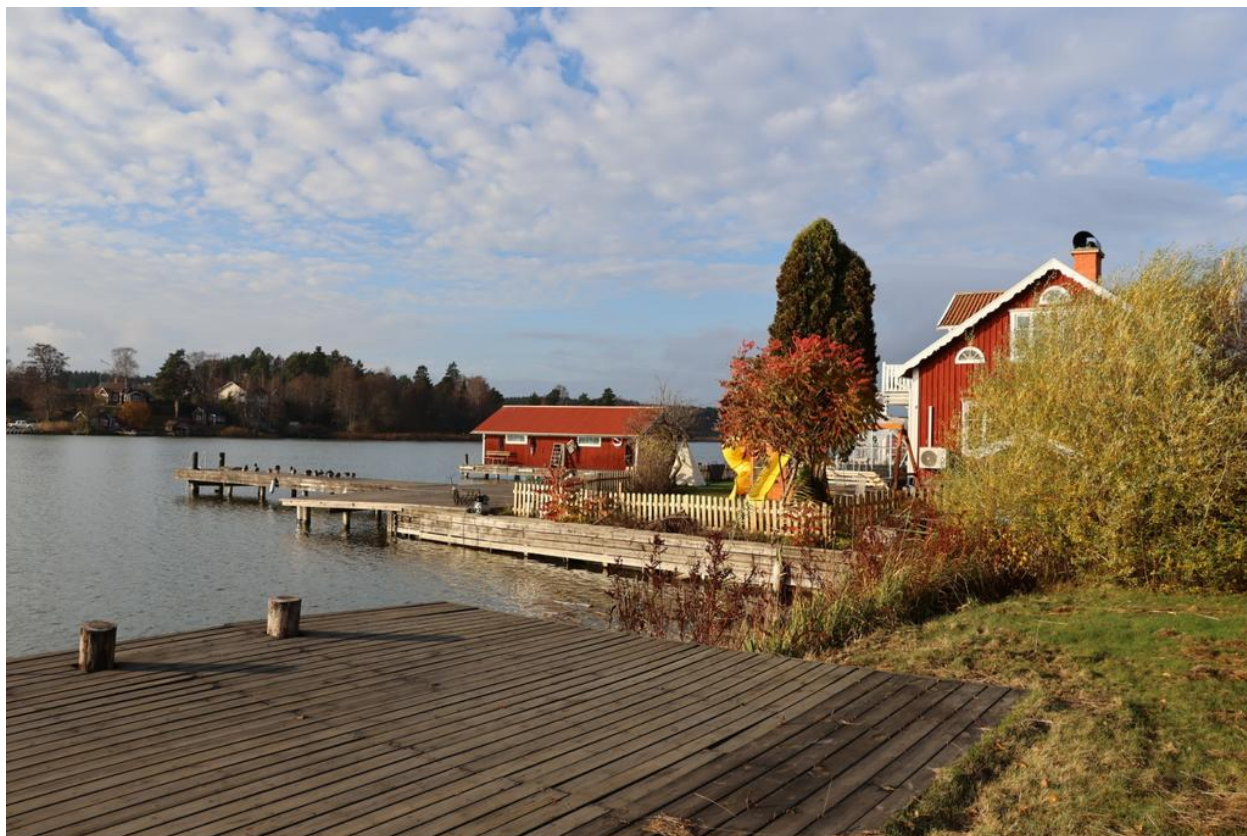
Del av Brygganläggning