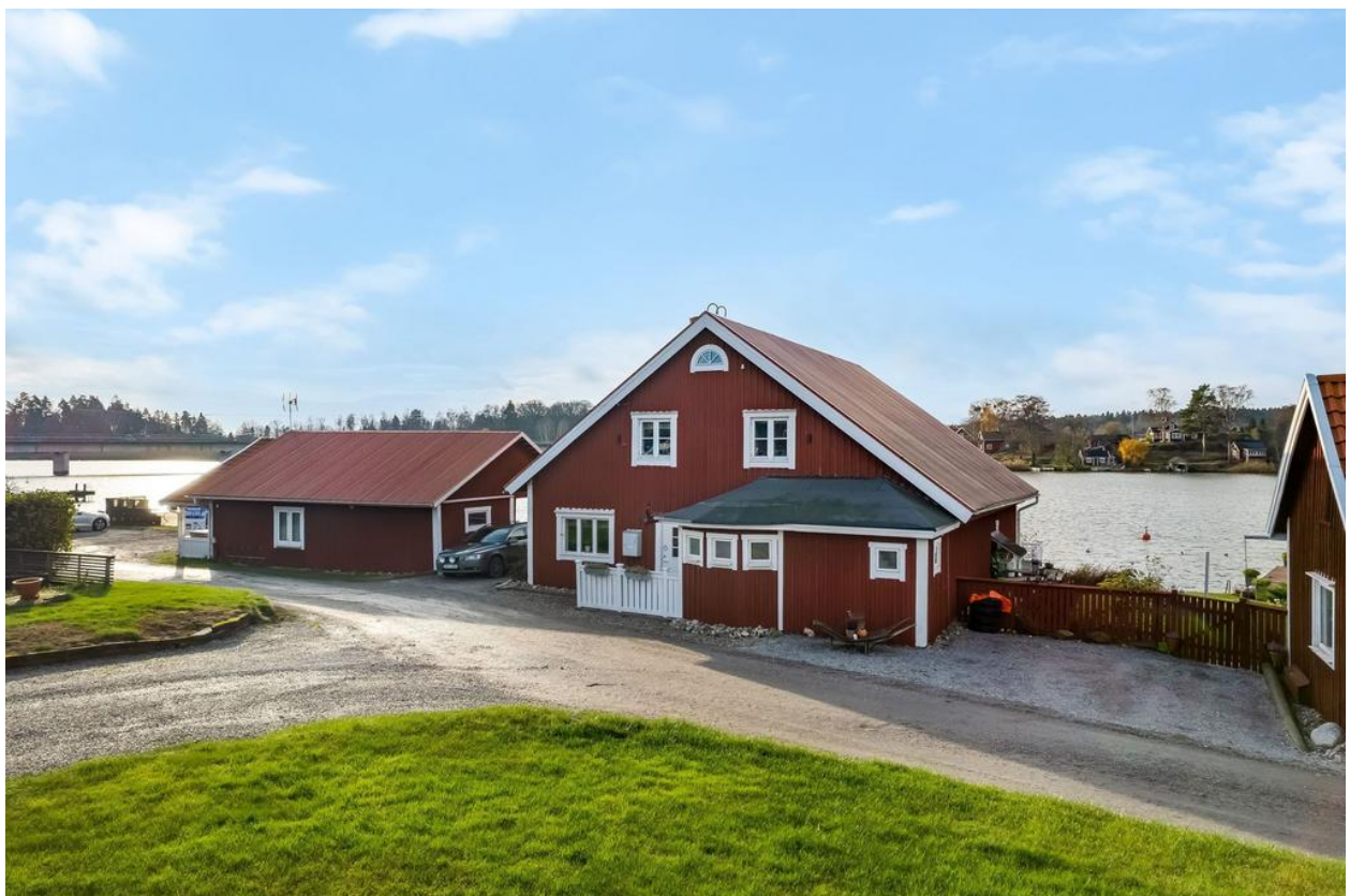
Garfveriet och Tegelhuset, kontor och gymlokal