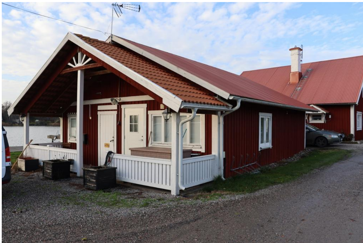
Tegelhuset, kontor och gymlokal.