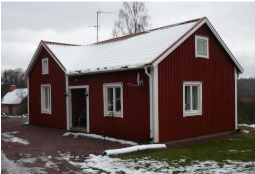
Hus 2 (Hemmingsbol 12)