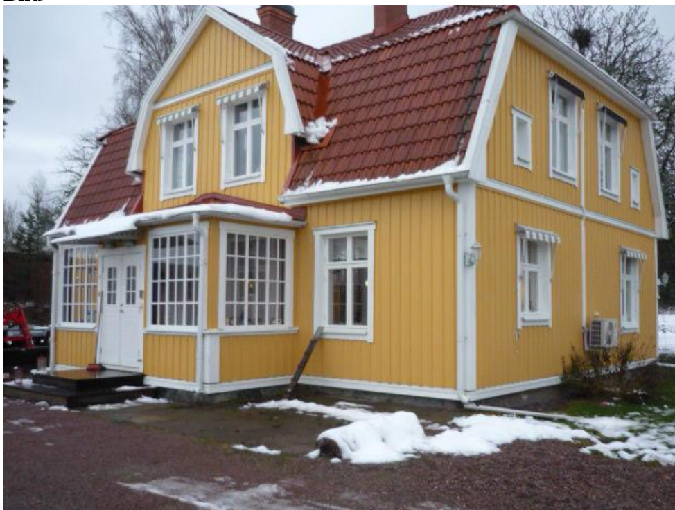
Hus 1 (Hemmingsbol 10)